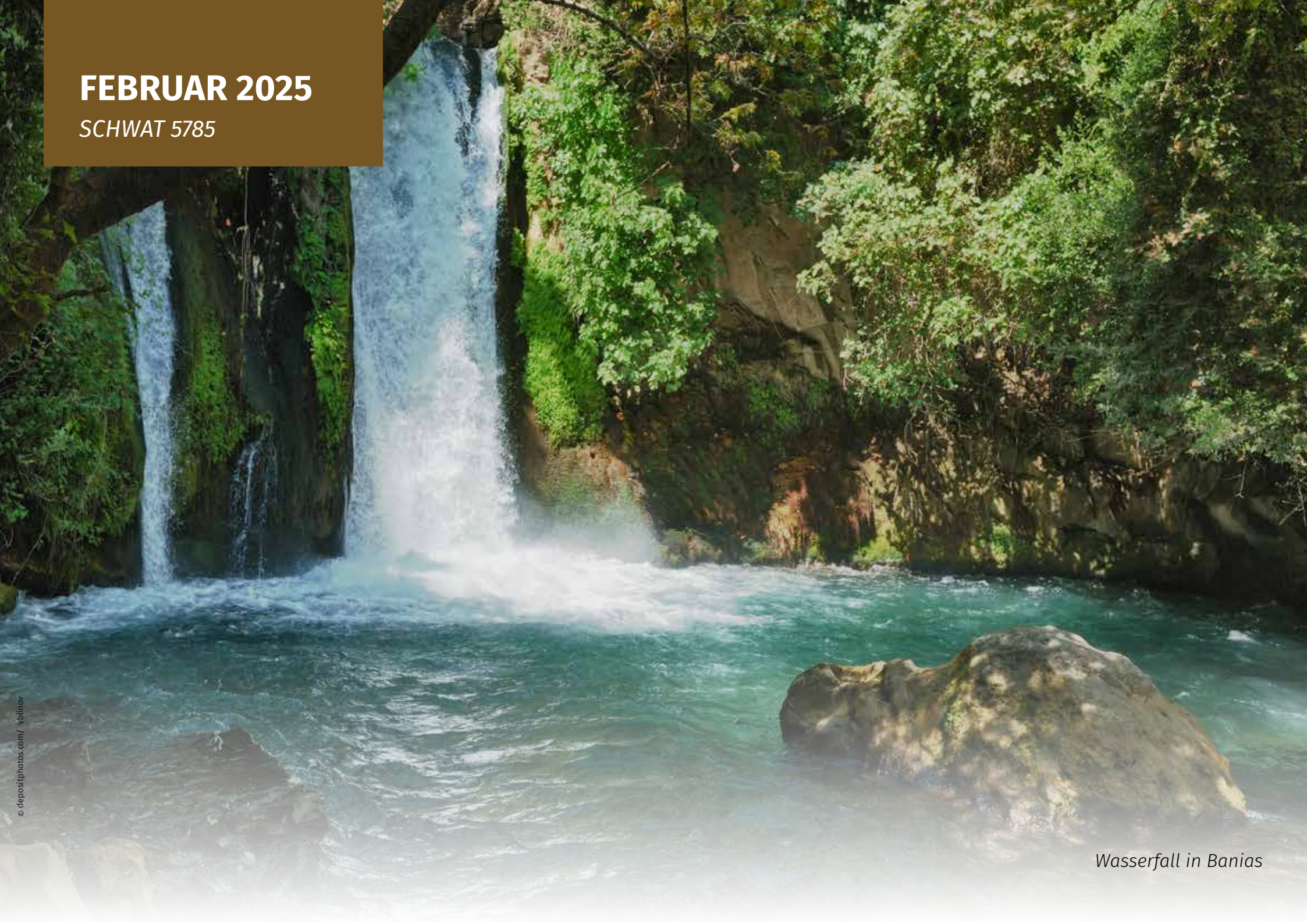
Wasserfall in Banias