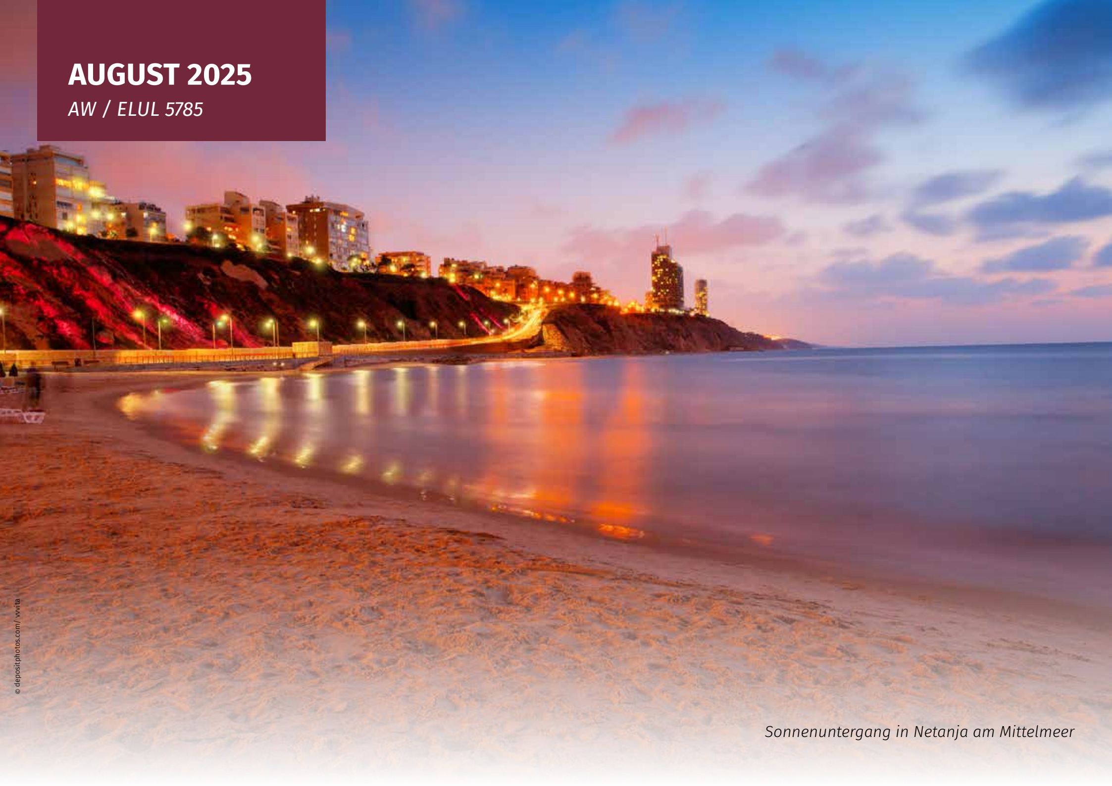
Sonnenuntergang in Netanja am Mittelmeer