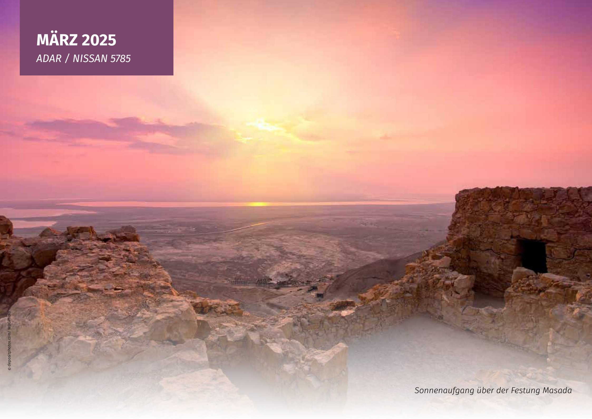
Sonnenaufgang über der Festung Masada