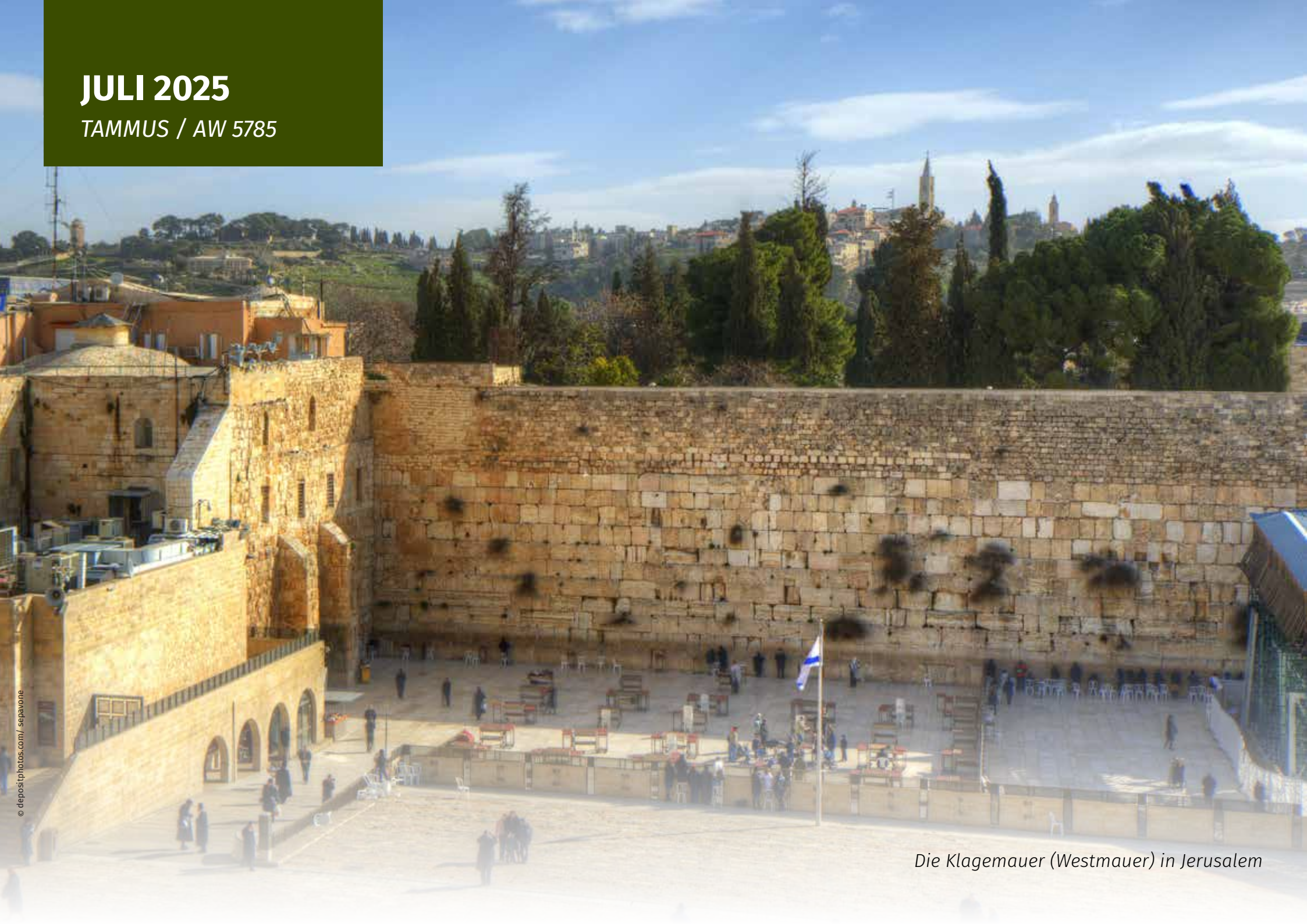
Die Klagemauer (Westmauer) in Jerusalem