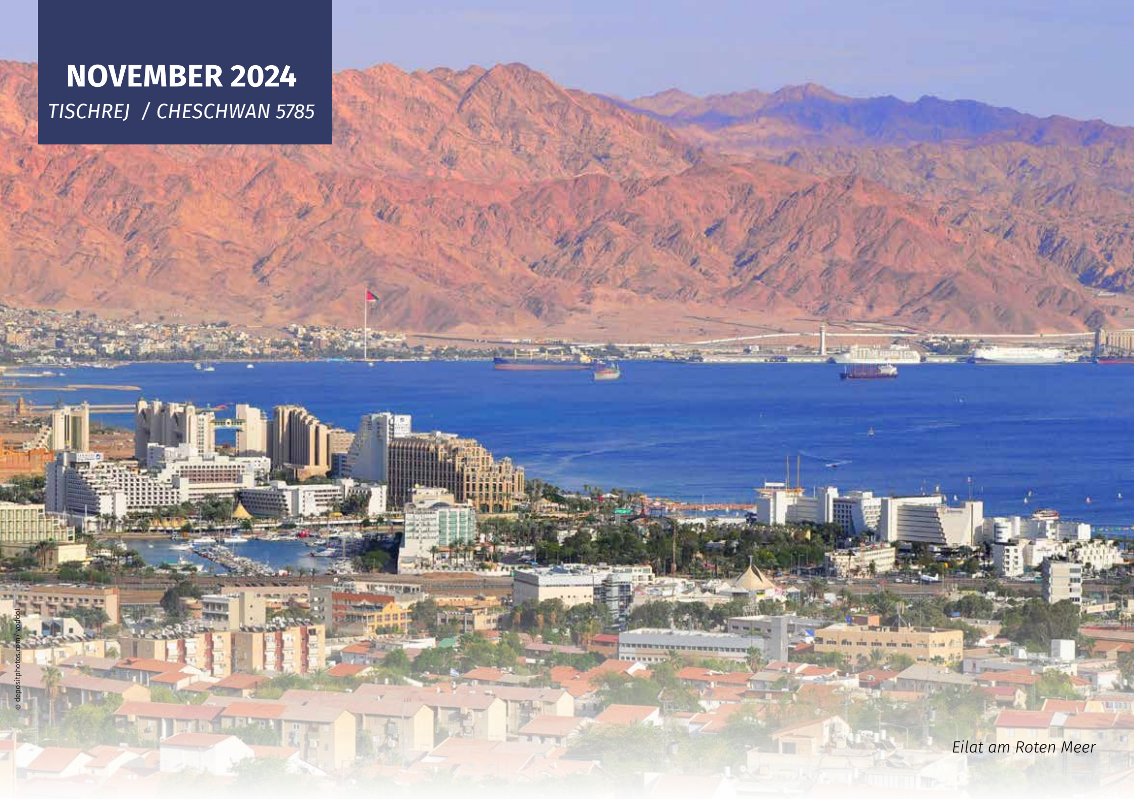
Eilat am Roten Meer