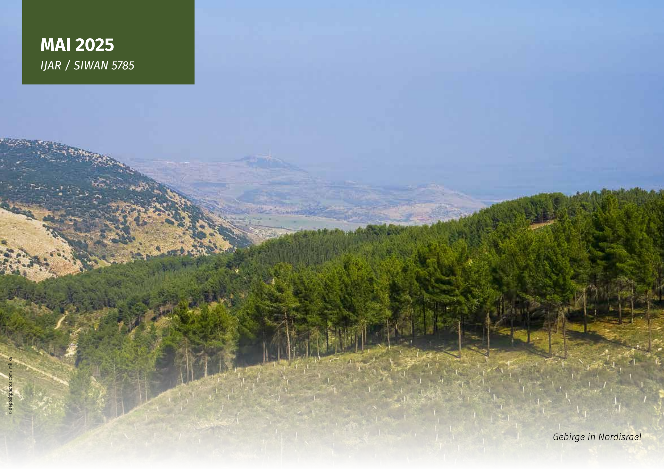
Gebirge in Nordisrael