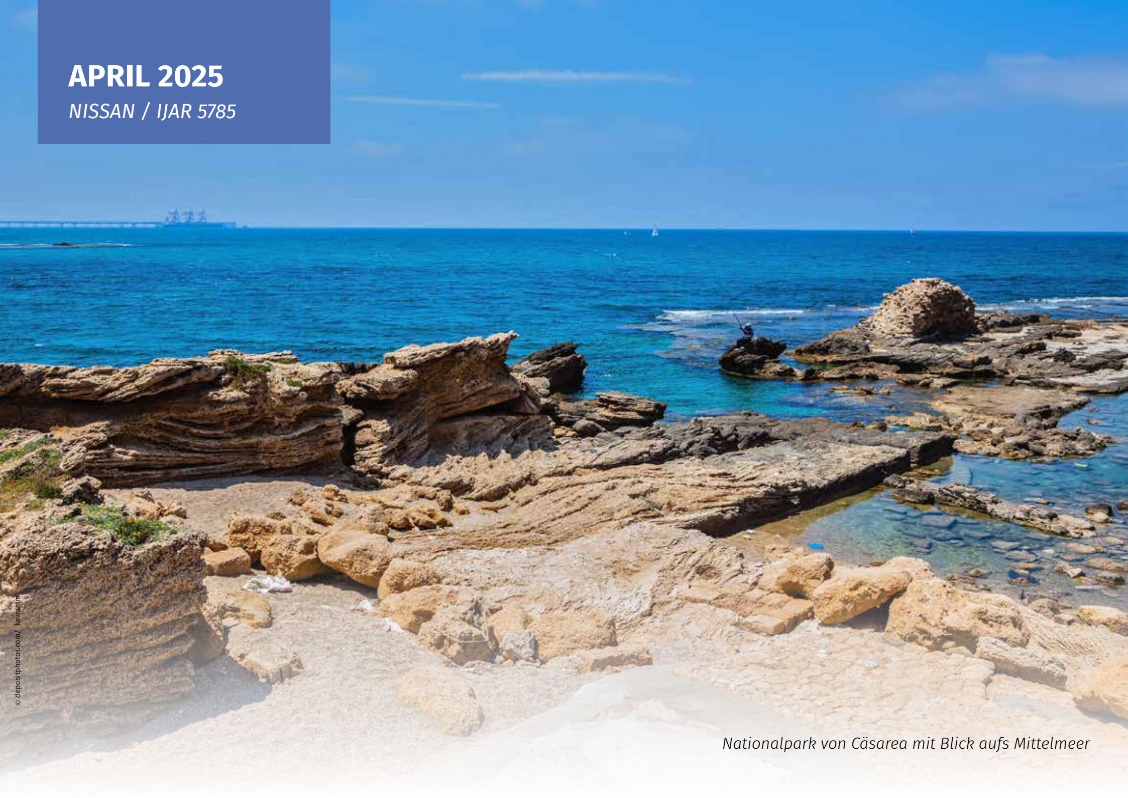
Nationalpark von Cäsarea mit Blick aufs Mittelmeer