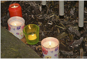
Kerzen für die Opfer von Halle

Opfer der Anschläge. Ein Besuch in der Laubhütte, die anlässlich des jüdischen Laubhüttenfestes aufgebaut worden war, und eine Führung durch die Synagoge beschlossen die Veranstaltung.(ci)+++